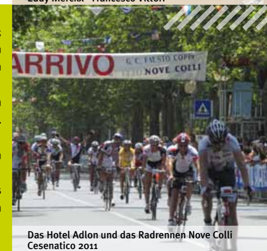
Das Hotel Adlon und das Radrennen Nove Colli Cesenatico 2011