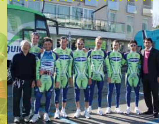
Liquigas Team Gast im Hotel Adlon in den Jahren 2004 - 2005 - 2006 - 2007 - 2008 - 2009 - 2010 - 2011