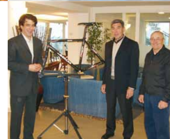
Liquigas Team ospite dell'Hotel Adlon nel 2004 - 2005 - 2006 - 2007 - 2008 - 2009 - 2010 - 2011

L'Hotel Adlon e Riccione Bike Hotels garantiscono il servizio di ristoro dopo il Barbotto e alla fine della corsa.