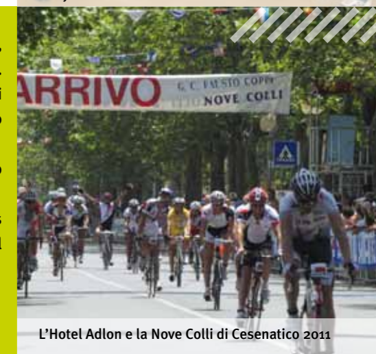
L'Hotel Adlon e la Nove Colli di Cesenatico 2011